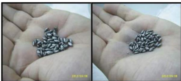
Sementes SOESP Advanced