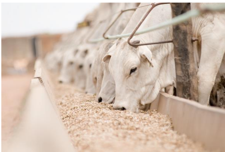
Figura 1. Confinamento bovino

Para entrar no confinamento é preciso estar atento ao mercado financeiro. Para o primeiro semestre de 2017, de acordo com a SCOT Consultoria, apesar da queda nos custos da dieta, com destaque para o milho, os patamares de preços do boi gordo fizeram com que a operação de confinamento bovino entregasse prejuízo aos produtores.