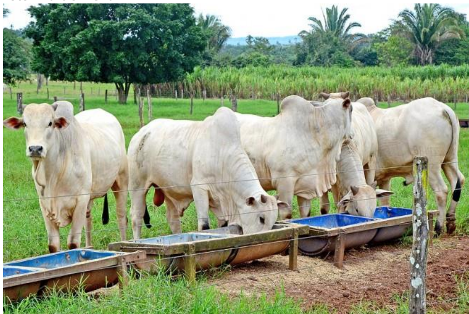
Figura 2. Sistema de Suplementação a Pasto.

Em áreas onde o sistema de suplementação a pasto com altas lotações, observa-se que nos anos subsequentes, os pastos apresentam maior produção de matéria seca. Esse fato pode ser justificado pelo retorno dos nutrientes ao solo por meio das fezes e urina dos animais. Sendo assim, pode-se concluir que, dependendo da forma de manejo que o sistema for conduzido, é possível diminuir os custos com adubação de manutenção do pasto.