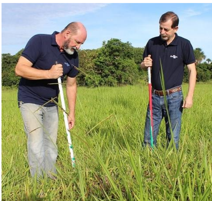
Figura 1. Medição da altura do pasto com régua.